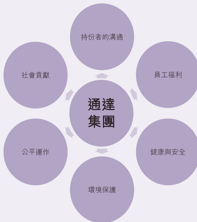
通達集團的企業社會責任模式

ESG報告覆蓋二零一九年一月一日至二零一九年十二月三十一日期間，包括了香港集團總部及中國各生產基地如石獅、廈門、深圳寶安、深圳沙井以及東莞。ESG報告主要按本集團的企業社會責任模式中各方面詳加闡釋，如工作環境質素，員工福利及培訓、健康與安全、環境保護、營運慣例，社區參與及持份者的溝通。於ESG報告內，除另有所指外，「本集團」一詞指通達集團控股有限公司及其附屬公司。