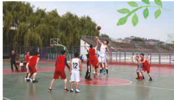
2016年鐵礦業務參加的體育活動情況表